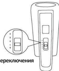
Тумблер переключения скоростей

- Прибор имеет четыре скорости. Для начала процесса, выберите первый уровень скорости и начните взбивание. Далее, Вы можете увеличить скорость вращения, передвинув тумблер регулировки скоростей от первого уровня до четвертого.